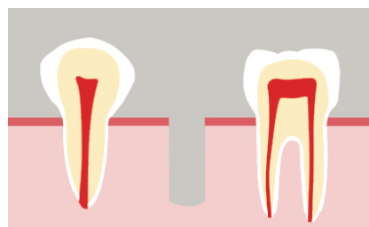
Préparation du site dans la mâchoire

Une fois l'implant ostéointégré, il nous servira d'appui pour poser une prothèse qui aura alors les mêmes fonctions qu'une dent naturelle : vous pourrez mâcher et sourire avec la même aisance.